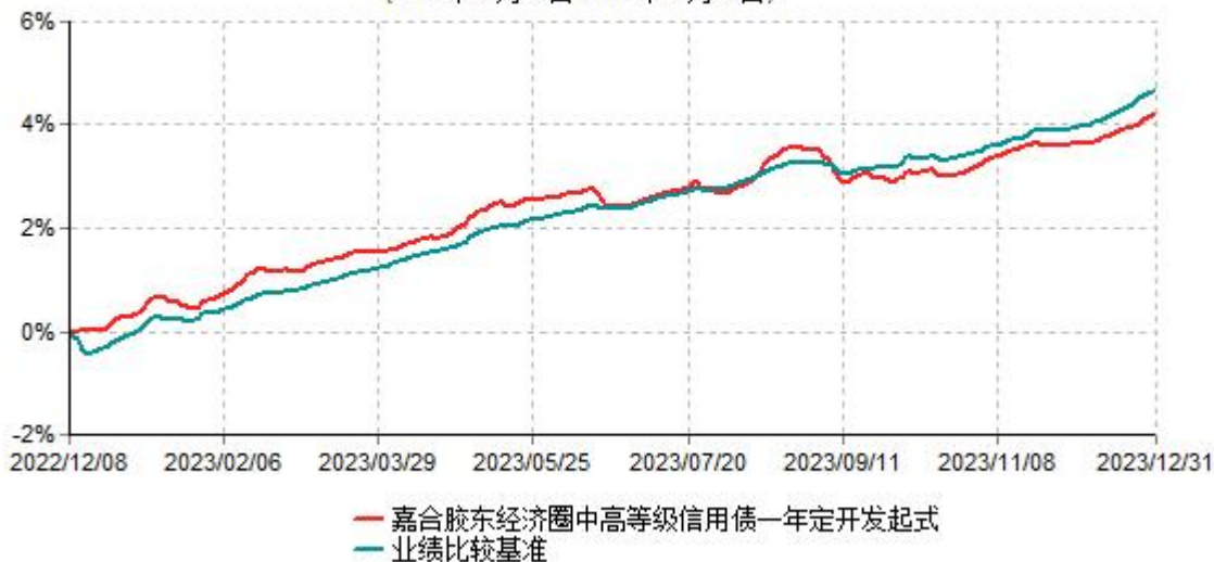
嘉合胶东经济圈中高等级信用债一年定期开放债券型发起式证券投资基金累计净值增长率与业绩比较基准收益率历史走势对比图 (2022年12月08日-2023年12月31日)

注：1、本基金合同于2022年12月08日生效，按基金合同规定，本基金自合同生效起6个月内为建仓期。建仓期结束时，本基金的各项资产配置比例符合基金合同约定。