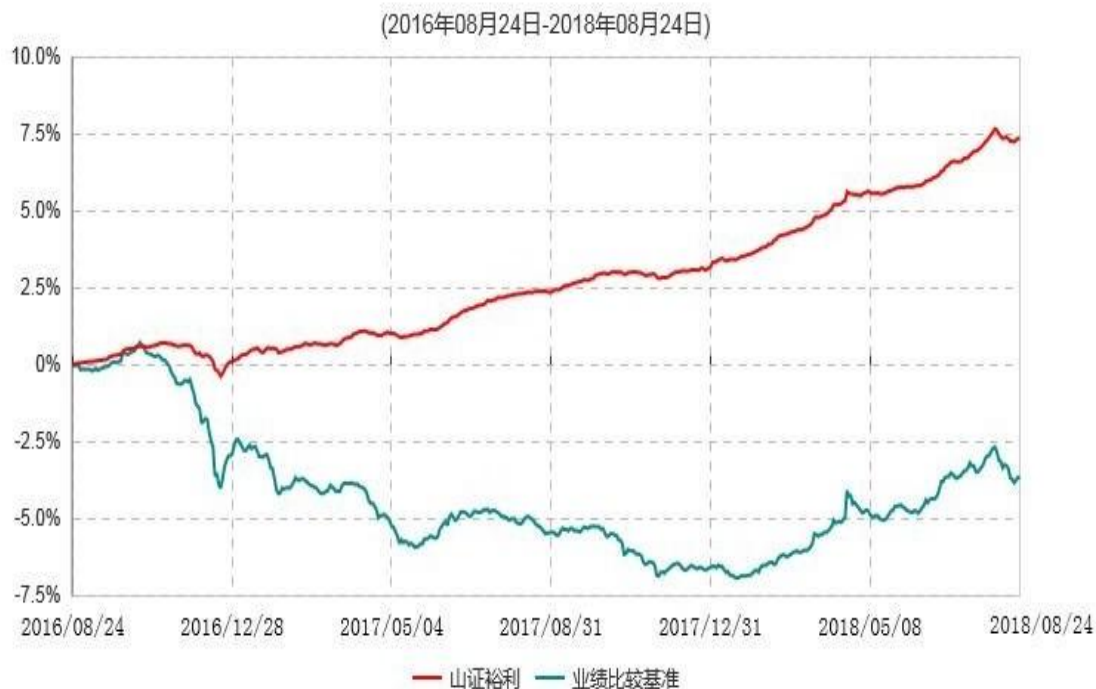
山西证券裕利债券型证券投资基金累计净值增长率与业绩比较基准收益率历史走势对比图

注：1. 按基金合同和招募说明书的约定，本基金自基金合同生效之日起6个月内使基金的投资组合比例符合基金合同的有关约定。