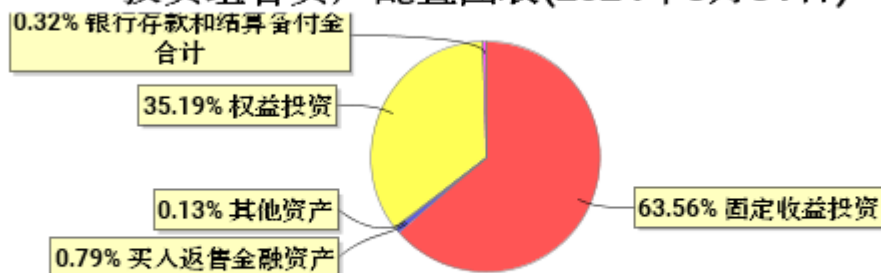
投资组合资产配置图表(2024年3月31日)

● 固定收益投资 ● 买入返售金融资产 ● 其他资产 ● 权益投资 ● 银行存款和结算备付金合计