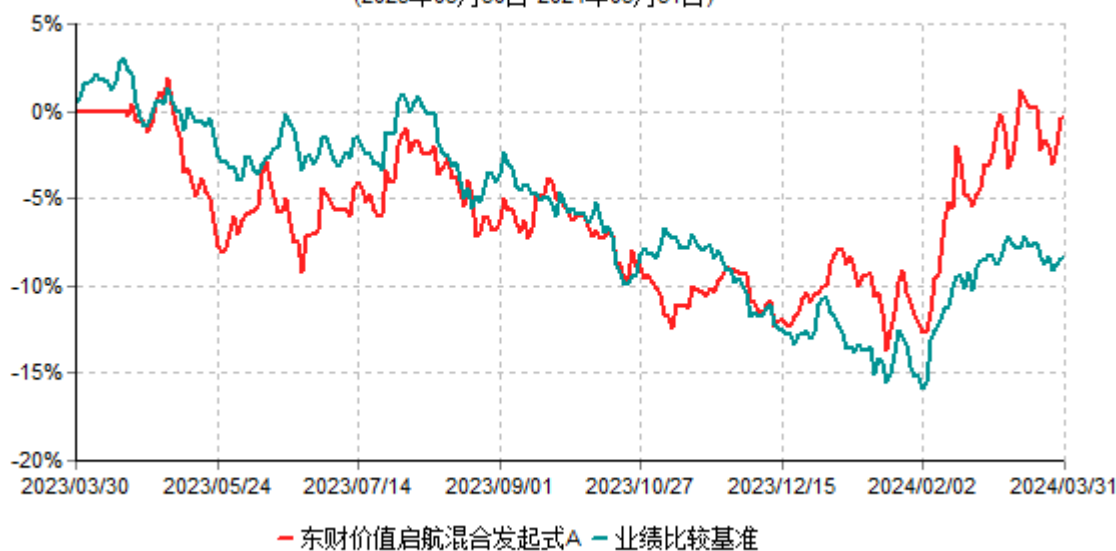
东财价值启航混合发起式A累计净值增长率与业绩比较基准收益率历史走势对比图 (2023年03月30日-2024年03月31日)